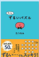
すこしずるいパズル [1] たつなみ／著 アリス館