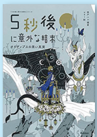
5秒後に意外な結末 —オイディプスの黒い真実— 桃戸ハル／編著 usi／絵 学研プラス