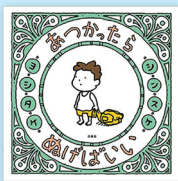
あつかったらぬげばいい ヨシタケシンスケ／著 白泉社