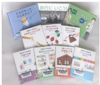
奥左から、 ●『ともだちってどんなひと?』 (赤木かんな子/著 濱口瑛士/絵 埼玉福祉会出版部) ●『旅行にいこう!』(藤澤和子/川崎千加・多賀谷津也子・小安展子/企画・編集・制作 樹村房) ●『ぼくと目の見えない内田さんがあつたはなし』 (赤木かんな子/著 濱口瑛士/絵 埼玉福祉会出版部) ●『仕事に行ってきます』シリーズ(埼玉福祉会出版部)