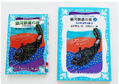
『銀河鉄道の夜』(宮沢賢治/作 太田大八/絵) (左)講談社青い鳥文庫 (右)講談社大きな文字の青い鳥文庫