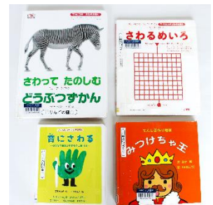
奥左から、 ●『さわってたのしむどうぶつずかん』 (ドーリング・キンダースルー社編集部/企画・編集 長瀬健二郎/日本語版監修 BL出版) ●『さわるめいろ』(村山純子/著 小学館) ●『音にさわる』(広瀬浩二郎/作 日比野尚子/絵 偕成社) ●『みつげちゃ王』(金子修/文 たかはしこうこ/絵 桜雲会)